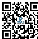
TOTUS(3D PLUS) 阿里巴巴国际站