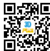
3D PLUS 品牌官网